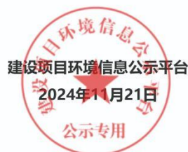
图 3.1-1 第一次网上公示证明