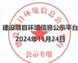
图 3.2-4 批前公示证明