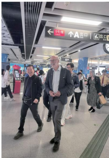
新西兰奥克兰市市长韦恩·布朗及代表团搭乘广州地铁。

11月8日下午,广州市市长孙志洋会见新西兰奥克兰市市长韦恩·布朗,孙志洋对韦恩·布朗及代表团一行的到来表示欢迎,并介绍广州城市发展概况。他说,今年是中澳建立全面战略合作伙伴关系10周年,也是广州与奥克兰缔结友好城市关系35周年。一直以来,两市友好往来关系密切,各领域合作成果丰硕,奥克兰是新西兰的重要城市和经济引擎,广州愿与奥克兰携手,共同落实好两国领导人达成的合作共识,持续深化两市经贸、港航、教育、文化、旅游等领域合作,加强交流交往和互学互鉴,为两国关系不断迈上新台阶作出更大贡献。