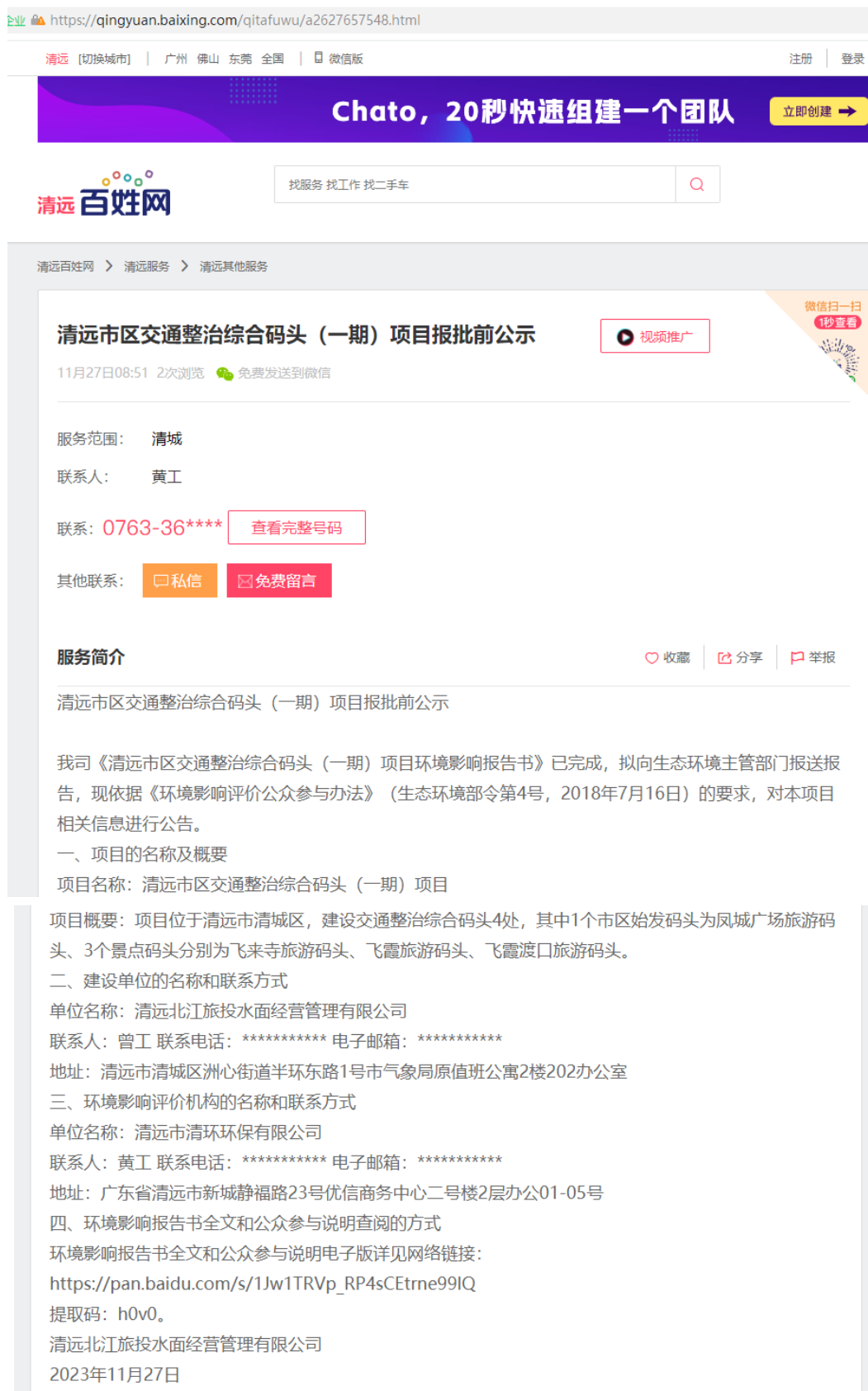
图 6.2-1 报批前公示网站截图