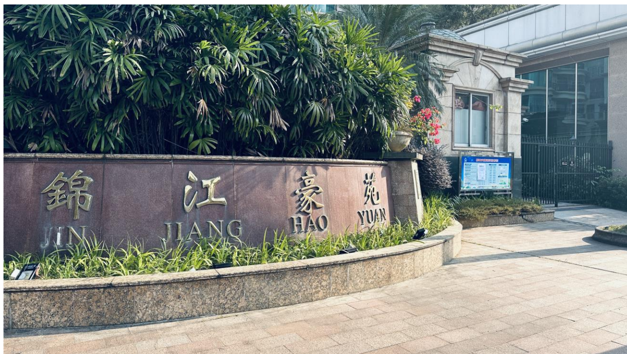
图 3.2-4 锦江豪苑现场张贴远景（11 月 13 日）

为方便当地村民了解项目信息，建设单位在进行征求意见稿网络公示的同时，以张贴公告的形式在项目周边受影响区域进行了征求意见稿信息公示，持续时间为 10 个工作日。公示张贴照片具体见图 3.2-4 和图 3.2-5。本项目征求意见稿环境影响评价信息公开选取本项目周边敏感点作为张贴区域，分别于小区入口、公告栏、村委会等这些易于知悉的场所张贴公告，并持续公开不少于 10 个工作日（2023 年 11 月 13 日至 2023 年 11 月 24 日），符合《环境影响评价公众参与办法》（生态环境部令 第 4 号）的要求。