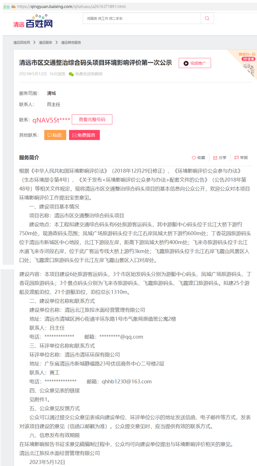
图 2.3-1 第一次公示网络截图