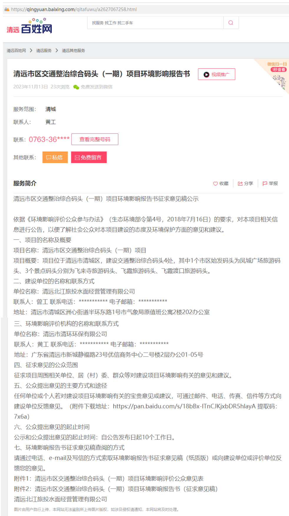
图 3.2-1 征求意见稿公示网络截图