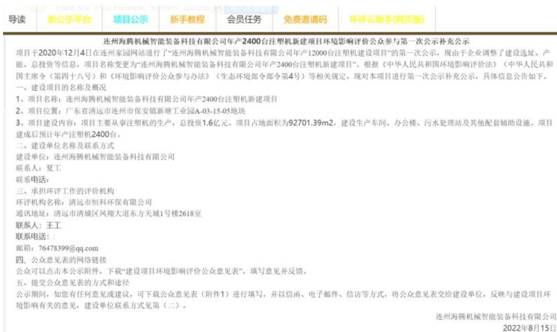
图 3.1-3 第一次网上补充公示截图